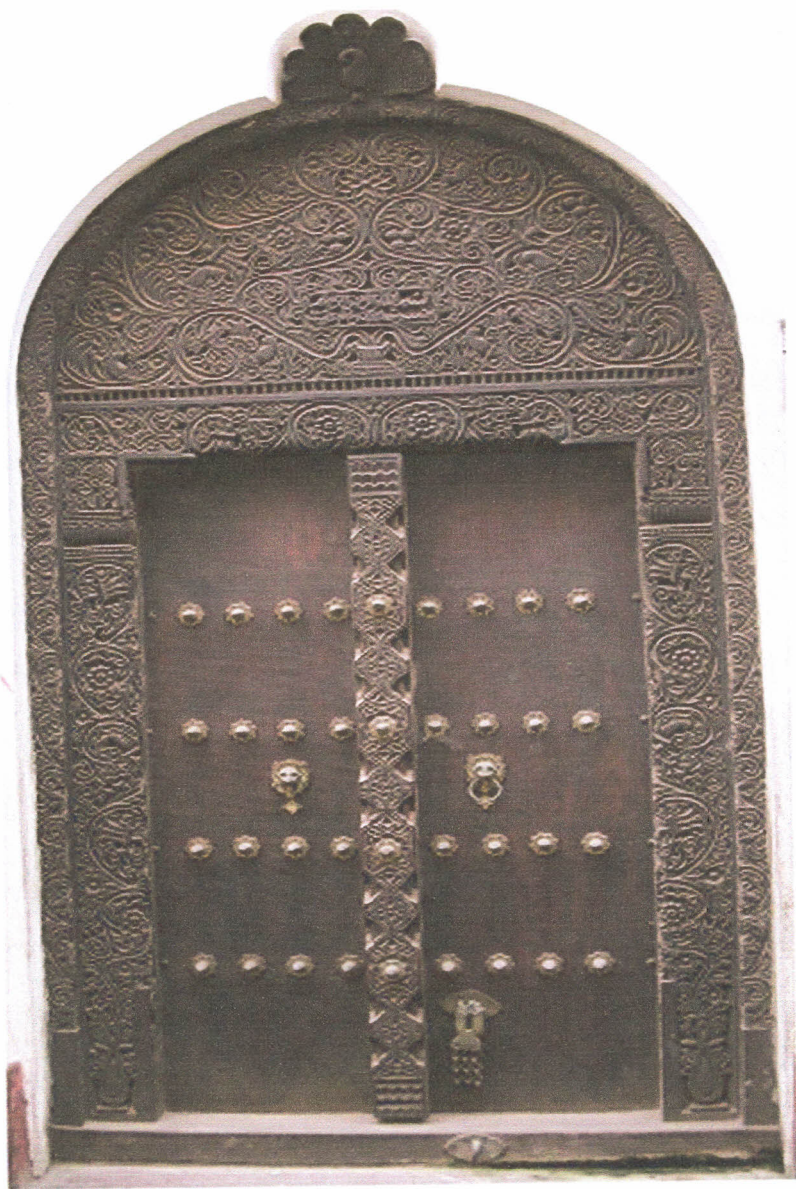
Mlango wa Lamu