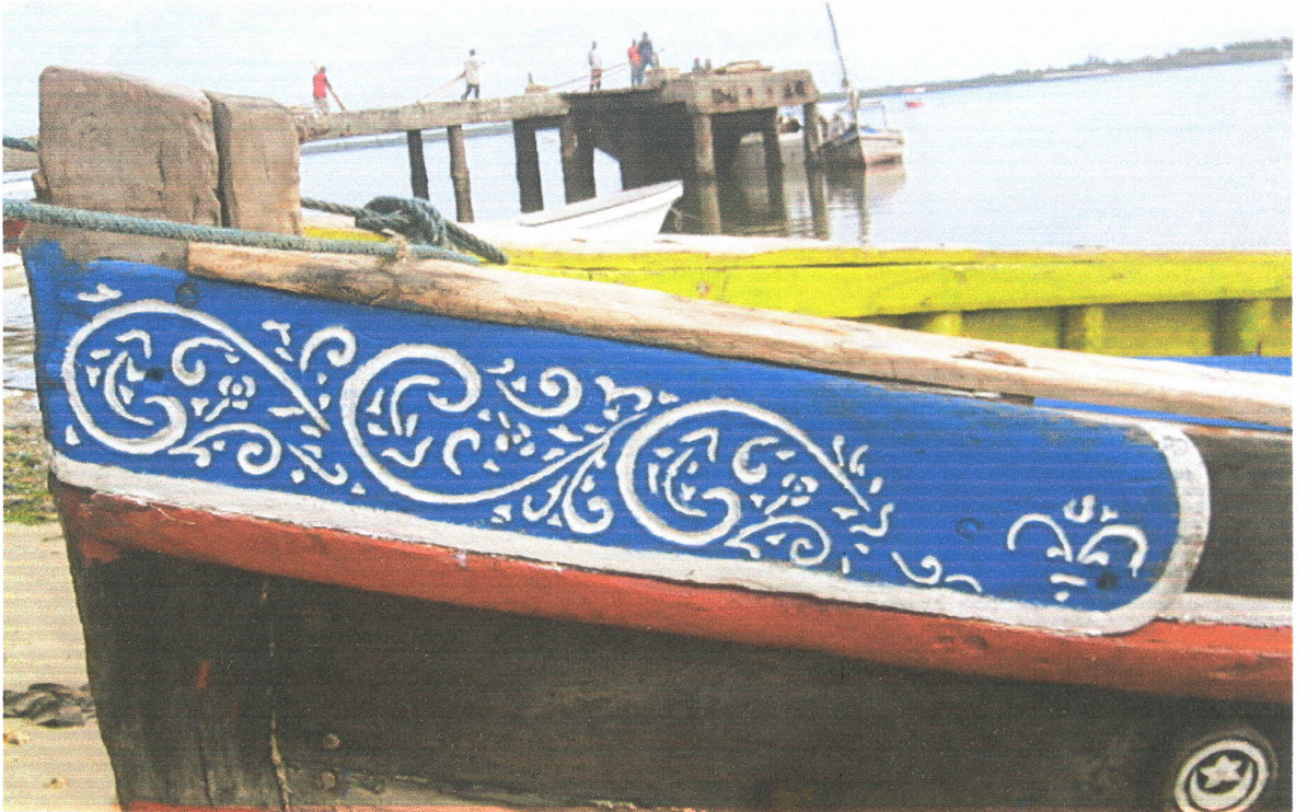
Mfano wa kutia Nakshi za kimapambo kwenye Jahazi .